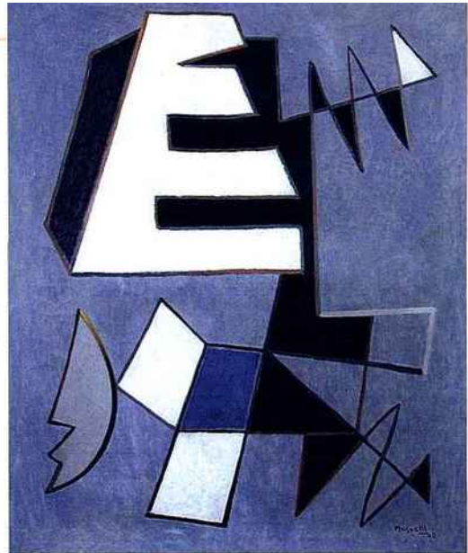
Alberto Magnelli, Attitude tranquille , 1945, huile sur toile, 100 x 82 cm, courtesy Galerie Lahumière, Paris.