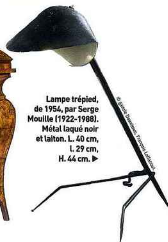
Lampe trépied, de 1954, par Serge Mouille (1922-1988). Métal laqué noir et taiton. L. 40 cm, L. 29 cm, H. 44 cm. ▶