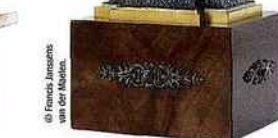
▲ Pendule de 1875, par les frères Fannièrre (Paris). Représentation des allégories des arts. Cadran en bronze doré, pendule en argent, lapis-lazuli et bois. H. 42 cm.