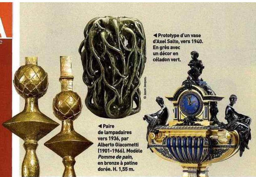
◀ Prototype d'un vase d'Axel Salto, vers 1940. En grès avec un décor en céladon vert.

> L'éclectisme du PAD. Le Pavillon des Arts et du Design (PAD) installe sa structure dans les jardins parisiens des Tuileries (1 er arr.) fin mars. Vitrine des arts décoratifs des xx e et xxi e siècles, le salon accordera cette année une place plus importante aux arts premiers. Une orientation qui s'intègre dans la volonté d'éclectisme cher aux organisateurs. Pavillon des Arts et du Design, du 27 au 1 er avril, au Jardin des Tuileries, 234 rue de Rivoli, 75001 Paris. Ouvert de 11 h à 20 h ; le 29, jusqu'à 22 h. Tél. 01 53 80 85 20.