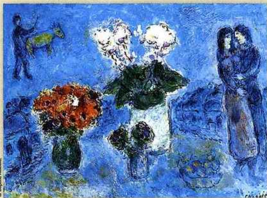
Les amoureux aux trois bouquets, de 1980. Huile sur toile de Marc Chagall, signée et datée au dos. Format : 54 cm x 73 cm. ▼