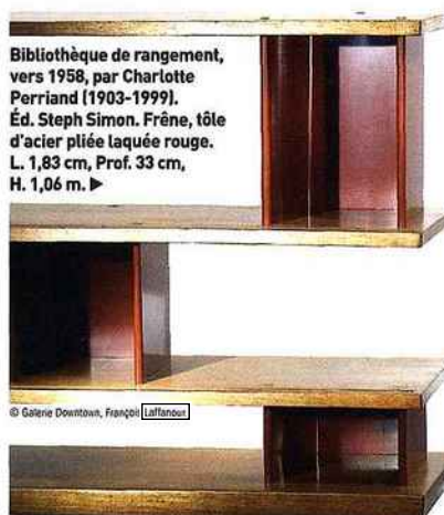
Bibliothèque de rangement, vers 1958, par Charlotte Perriand (1903-1999). Éd. Steph Simon. Frêne, tôle d'acier pliée laquée rouge. L. 1,83 cm, Prof. 33 cm, H. 1,06 m. ▶