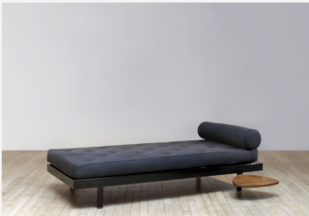
Jean Prouvé Lit S.C.A.L., 1954

11 av. Princesse Grace, 98000 Monaco T. +377 93 25 27 14 www.11columbia.com