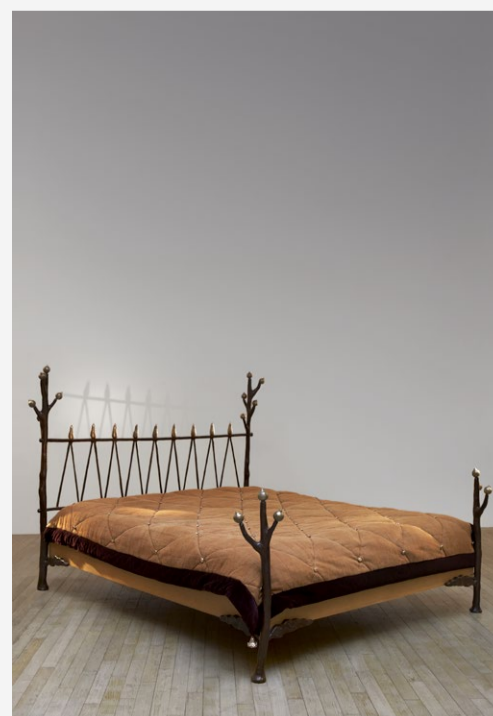
Elizabeth Garouste & Mattia Bonetti Lit « Beaux Rêves », 1990.

Pour contacter Gallery 11 Columbia : vknaebel@11columbia.com +33 6 07 93 68 79 +377 93 25 27 14