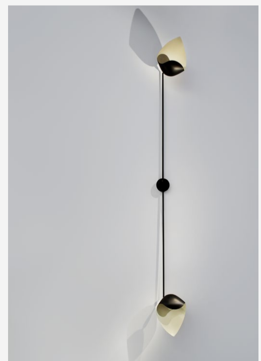
Serge Mouille Applique « Coquille », Ca 1958