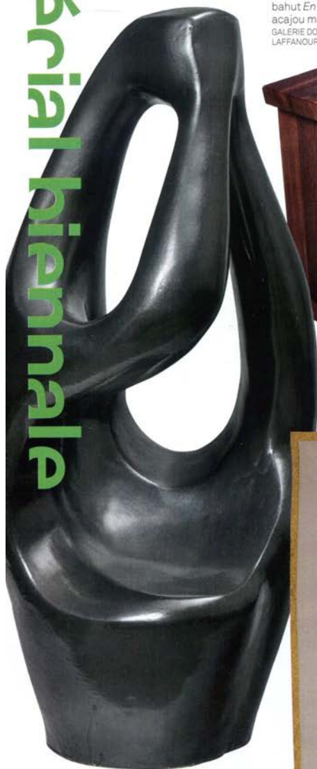
Georges Jouve, sculpture, v. 1954, céramique émaillée, H. 95 cm GALERIE JACQUES LACOSTE, PARIS.