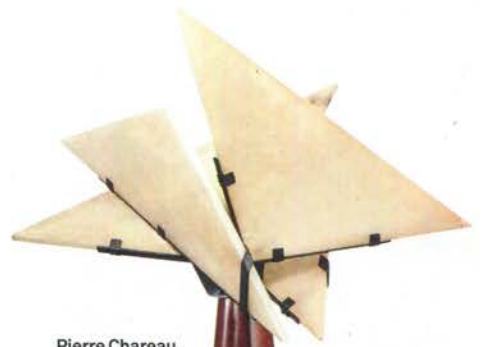
Pierre Chareau, lampadaire La Religieuse, 1928 (modèle créé en 1923), H. 180 cm GALERIE MARCILHAC, PARIS.