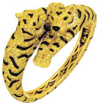
Bracelet en or, diamants jaunes et blancs, émeraudes et onyx, Cartier, 1990.