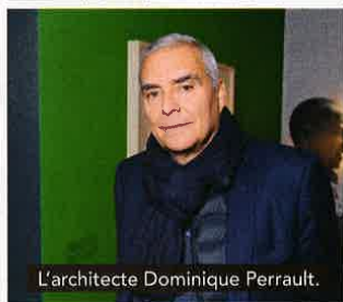
L'architecte Dominique Perrault.