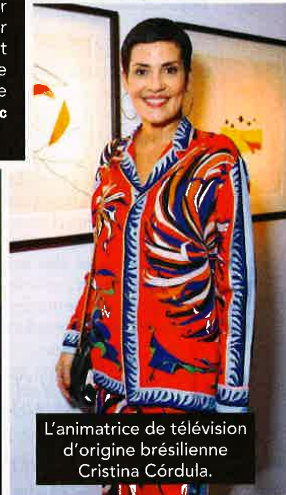
L'animatrice de télévision d'origine brésilienne Cristina Córdula.