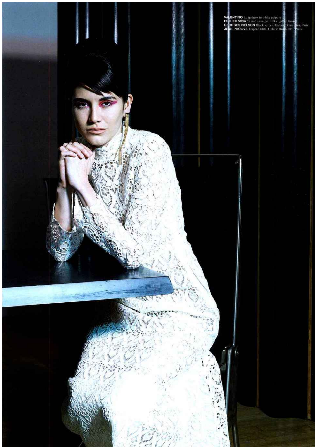
VALENTINO Long dress in white guipure ESTHER VINA "Rain" earrings in 24 et gilded brass GEORGES NELSON Black screen, Galerie Downtown, Paris JEAN PROUVE Trapèze table, Galerie Downtown, Paris.