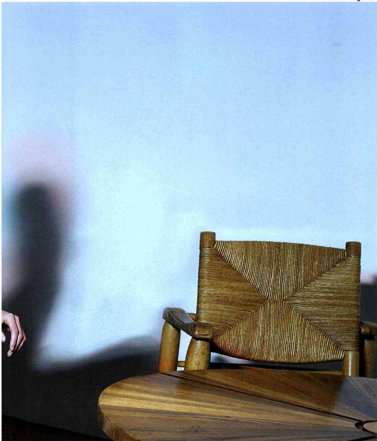
LOUIS VUITTON "Small damier" jacket in dark maroon and white gabardine "medium damier" skirt in dark maroon and white gabardine ESTHER VINA "Force" cuff in 24 ct gilded brass CHARLOTTE PERRIAND Chair and table, Galerie Downtown, Paris.