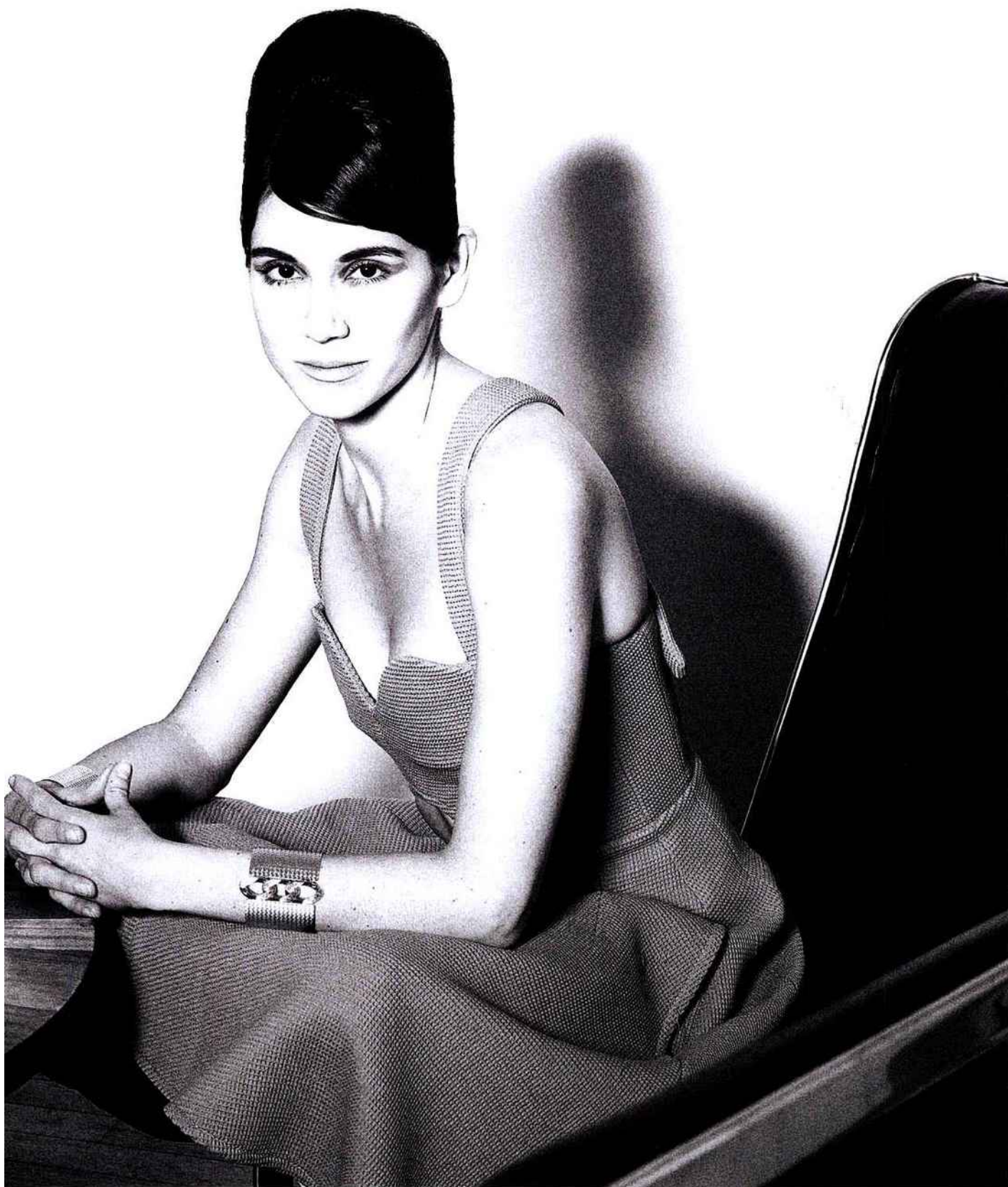
CARVEN Sleeveless dress with cross back strap, "vague" beehive neck in Havana cotton, color: sand ESTHER VINA "Paris" cuff in 24 ct gilded brass CHARLOTTE PERRIAND Chair and table, Galerie Downtown, Paris.