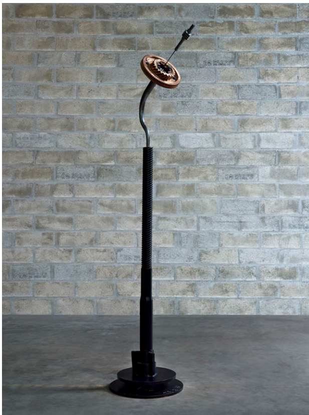
Takis, Fleur, 1983

Exhibition from April 12th to June 22nd 2015.