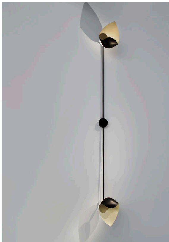
Serge Mouille, Applique « Coquille », 1958