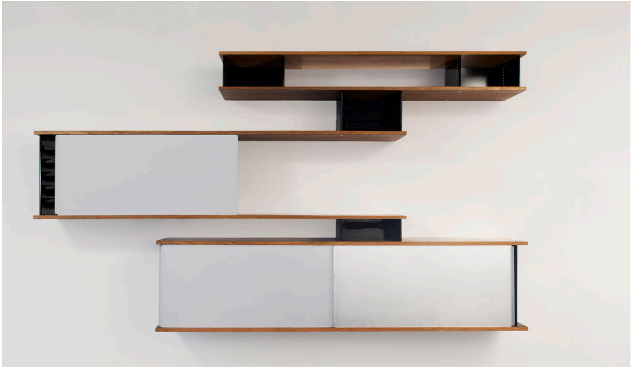
Charlotte Perriand, Bibliothèque murale « Nuage », 1958