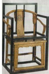
Autre sculpture «Boundary»

Une vingtaine de designers de l'empire du Milieu sont mis à l'honneur chez Piasa. Une première