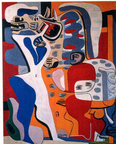
Le Corbusier. Menace , 1938.