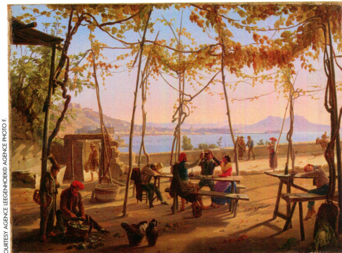
Frans Vervloet. La baie de Naples vue d'une terrasse à Mergellina. Signé et daté indistinctement « F. Vervloet Napoli 183.. »