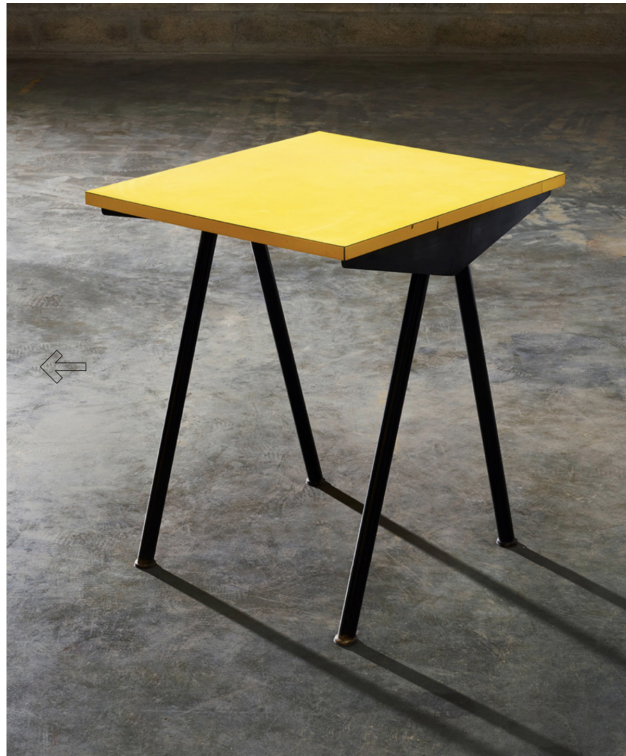
La Cité Universitaire de Jean Prouvé à la galerie Perrotin Matignon

Galerie Perrotin, 8 avenue Matignon, 75008 Paris Jusqu'au 25 février 2023