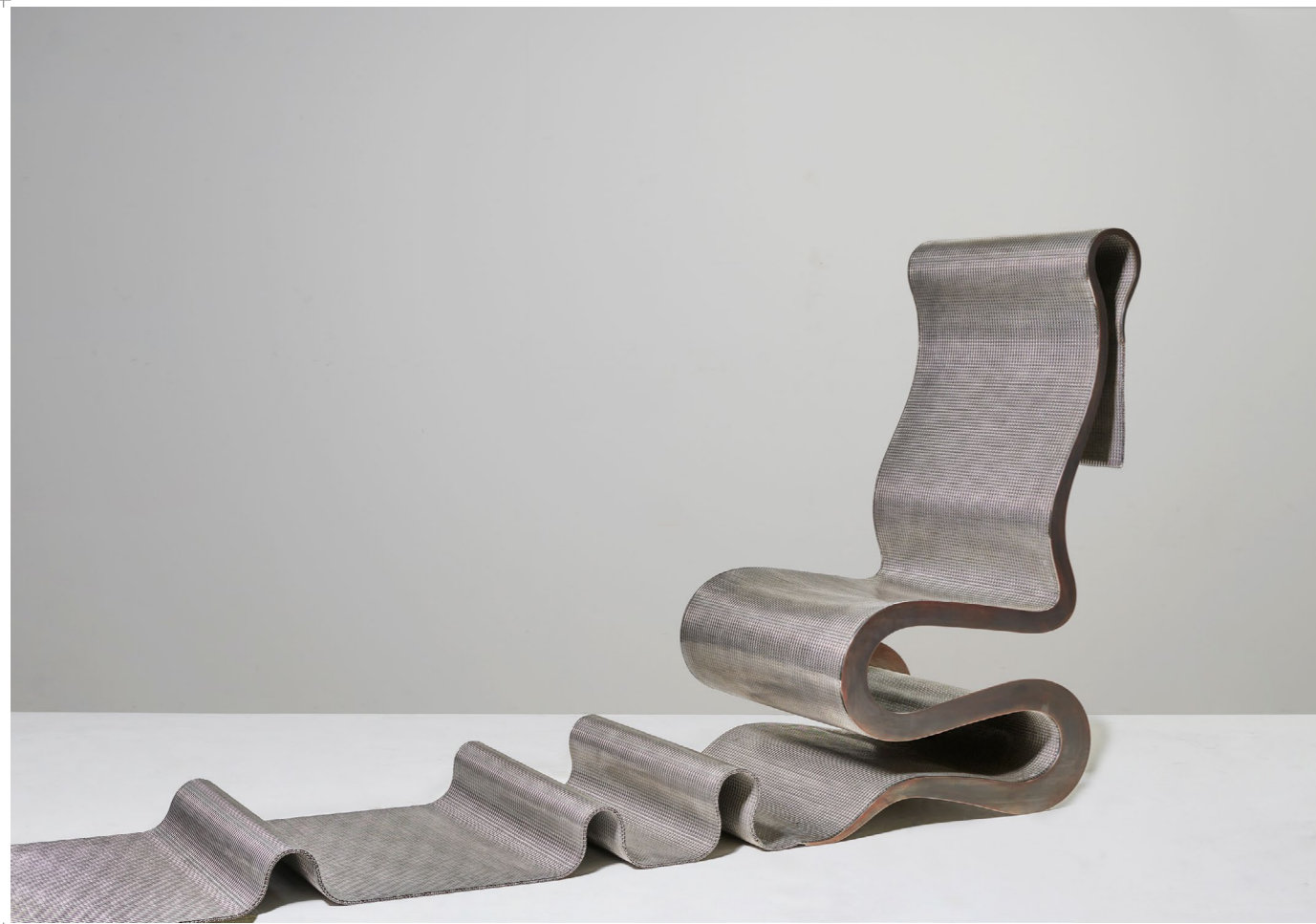
01. Ron Arad