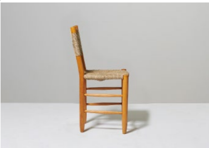
07. Charlotte Perriand