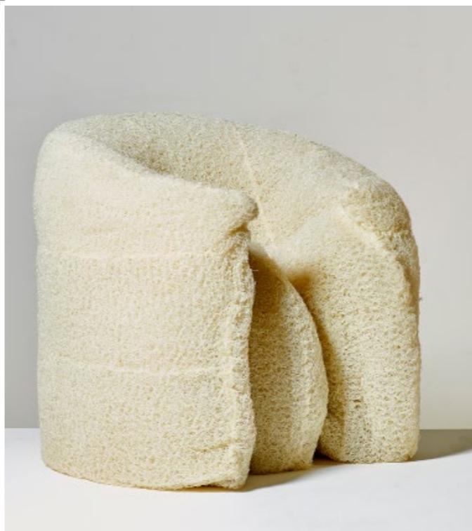
10. Tokujin Yoshioka