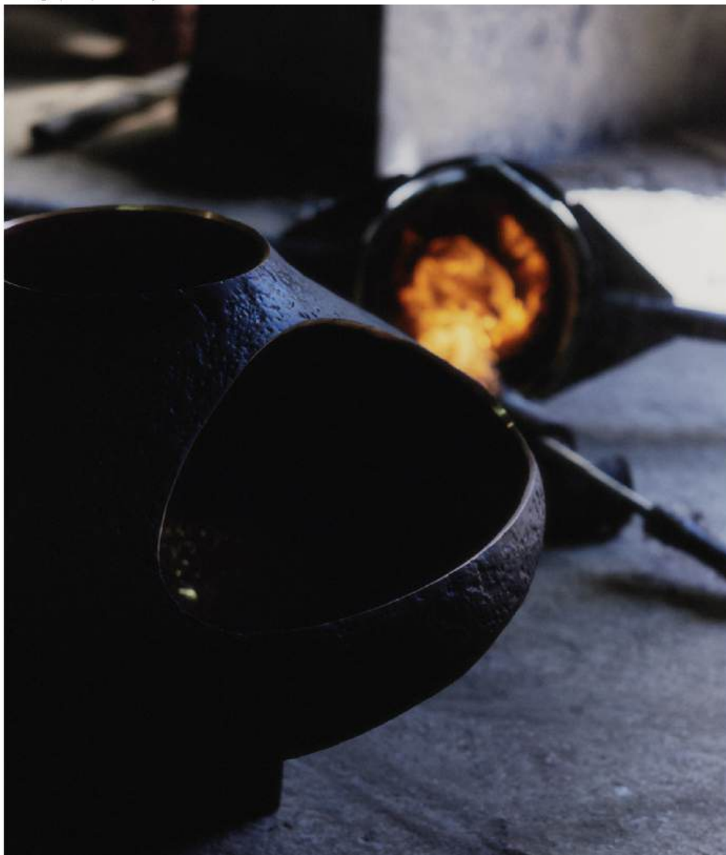
'Bronze 01', 2025