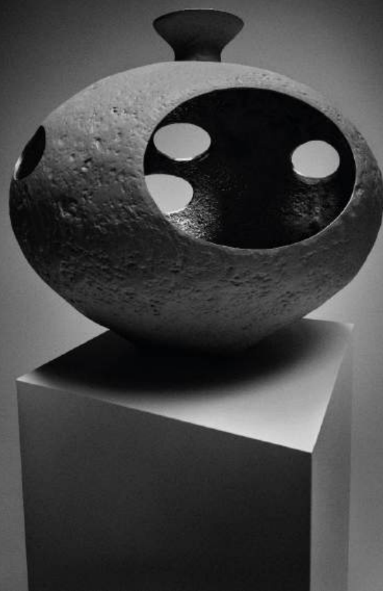
'Bronze 08', 2025

L'exposition présente également une nouvelle série de photographies en noir et blanc de Julien Martinez Leclerc , mettant en lumière l'intensité sculpturale et la profondeur matérielle des œuvres, tout en soulignant les qualités tactiles et volumétriques du bronze.