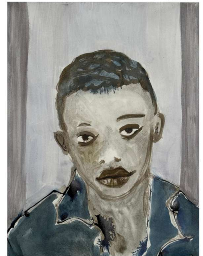
„Bijoux“, 2026 Encre sur papier 65 x 50 cm