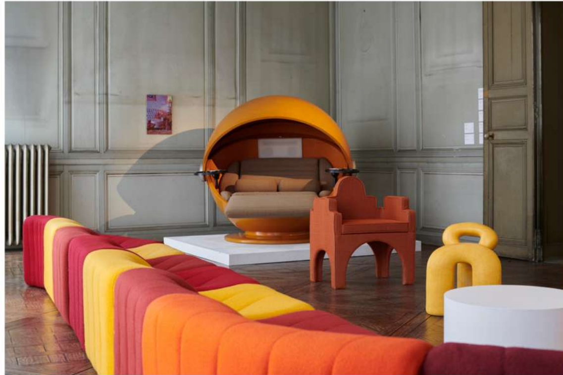
downtown+ 'trônes' Exposition