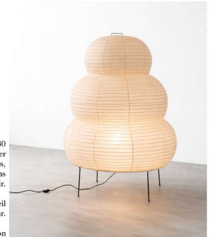
Lampe 'Akari' 25N, Ca. 1960 Papier fabriqué à partir de la pulpe du mûrier (Mino), structure interne en bois, reposant sur quatre pieds métalliques fins laqués de noir.

Idéogramme de l'artiste représentant le soleil et la lune rouges au bas de l'abat-jour.