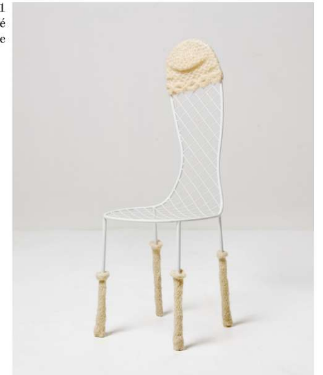
Family chair C, Ca. 2011 Acier et mohair tricoté Pièce unique