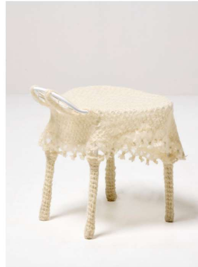
Family chair D, Ca. 2011 Acier et mohair tricoté Pièce unique