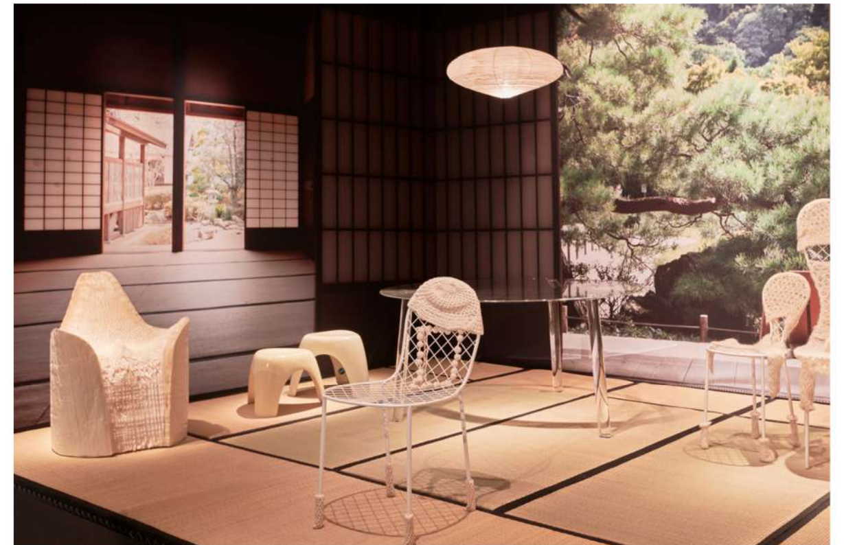
Design.Miami Basel 2024 Foire © downtown+