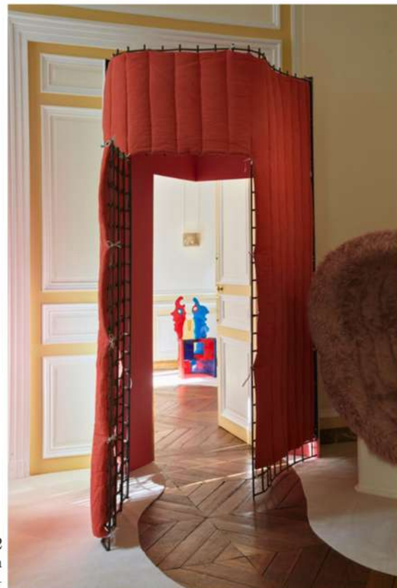
downtown+ trônes 2 Exposition