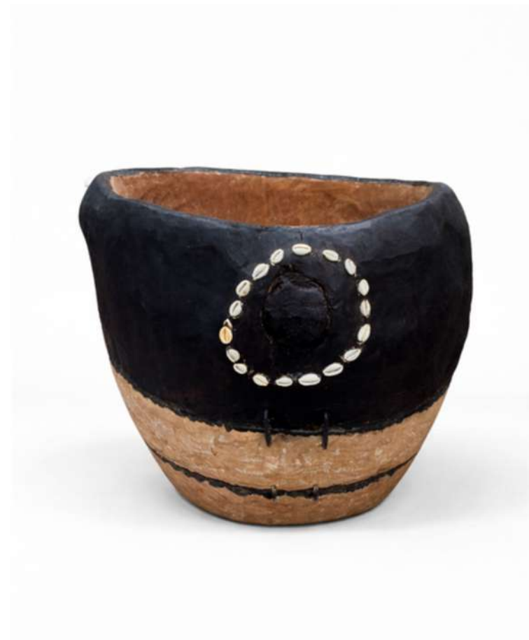
Untitled, 2025 Sculpture en bois et coquillages