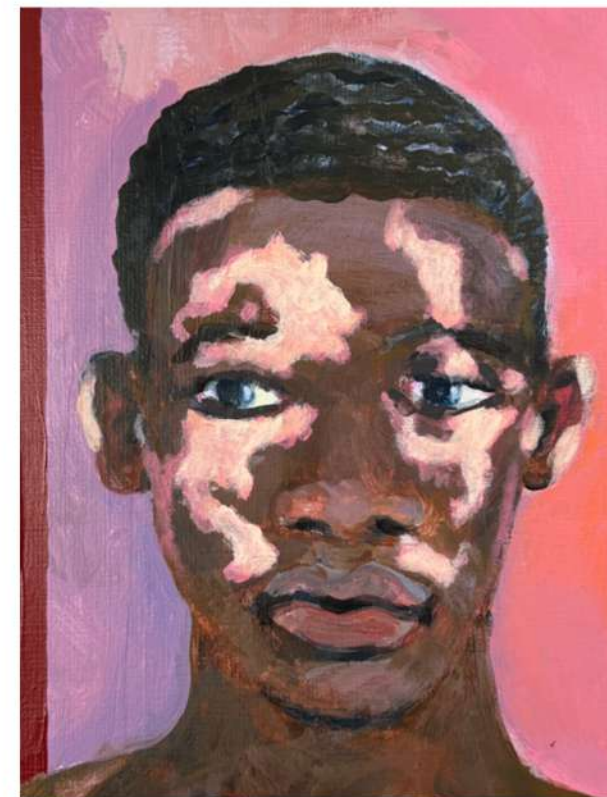
„To be titled“, 2026 Acrylique sur toile 27 x 22 cm