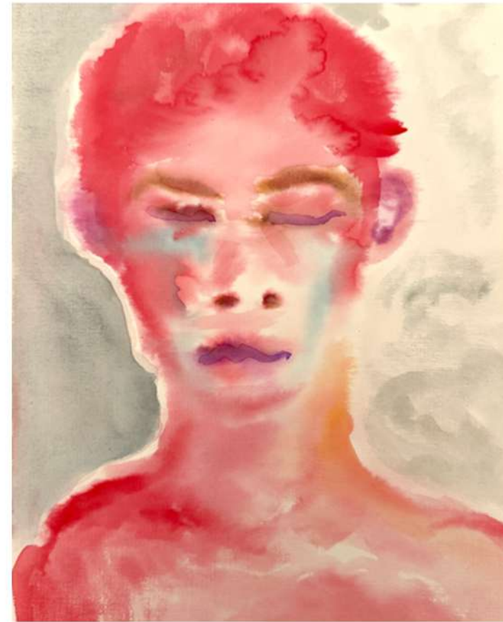
„Tim“, 2024 Aquarelle sur papier 24 x 17 cm