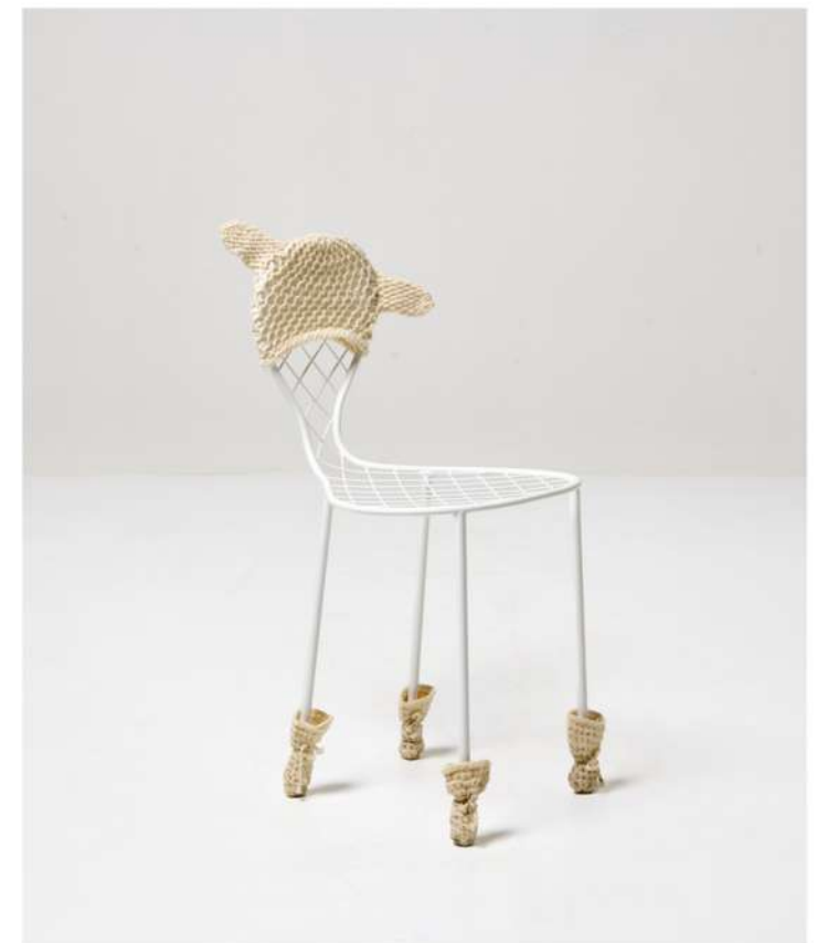
Family chair E, Ca. 2011 Acier et laine tricotée Pièce unique