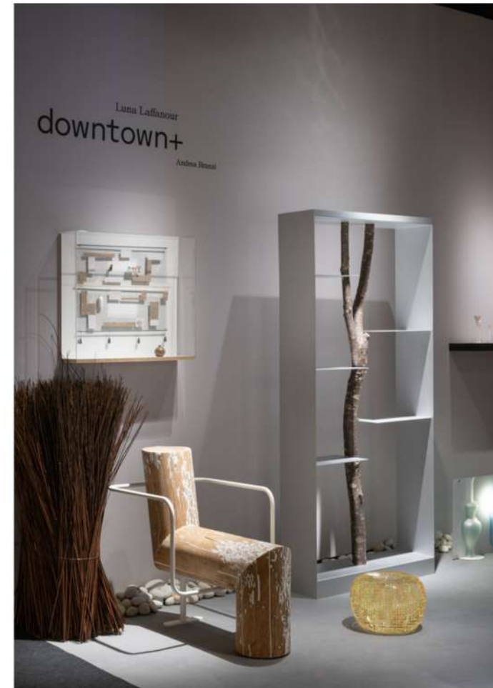
PAD Paris 2025 Foire