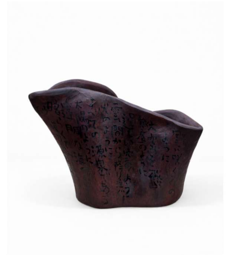
Untitled, 2025 Sculpture en bois et encre