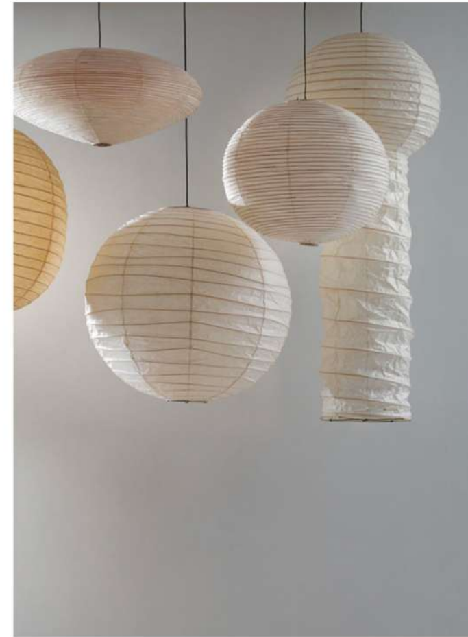
Suspensions 'Akari', Ca. 1960 Abat-jours en papier fabriqué à partir de la pulpe du mûrier (Mino), structures internes en bois.

Idéogramme de l'artiste représentant le soleil rouge et la lune, sur les abat-jours.