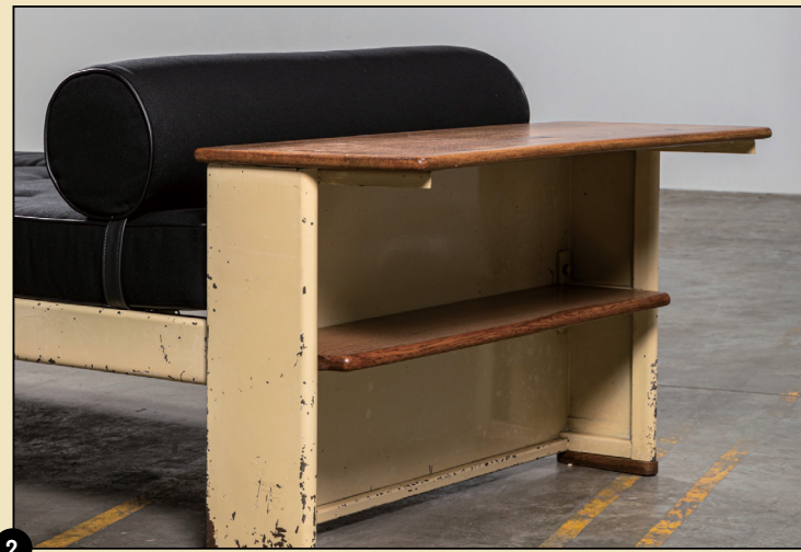
글 양윤정(아트 칼럼니스트) 에디터 김수진